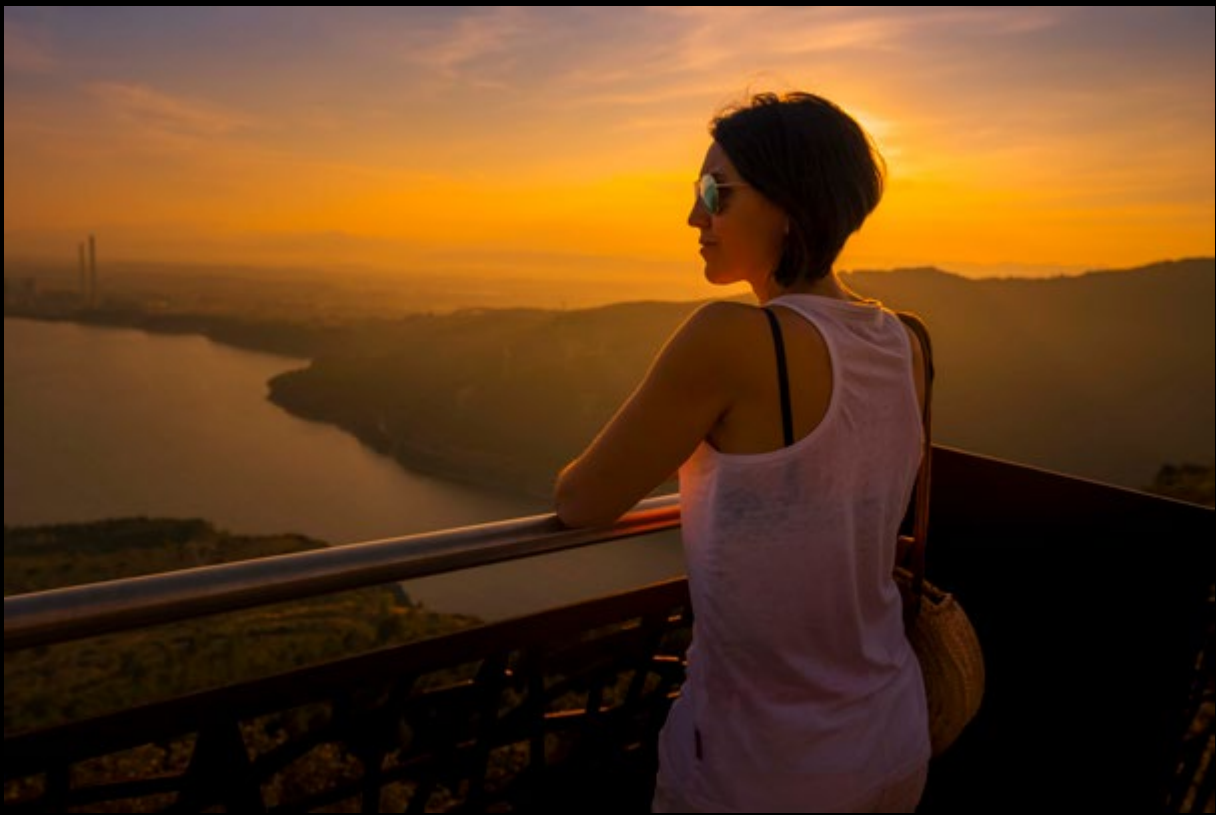
Atardecer en la Peña. (ramoncallejo)