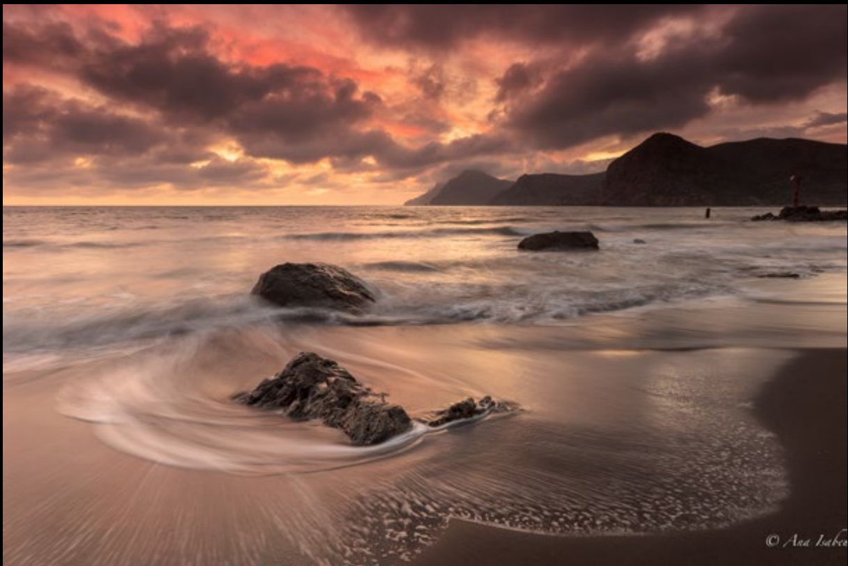
Atardecer otoñal / Autumn sunset (Ana Isabel Iranzo)