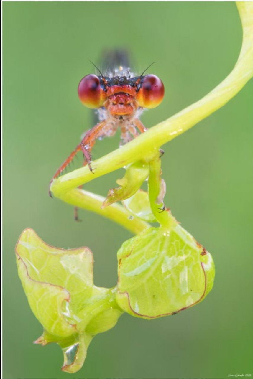
Say hello! (xisco99)