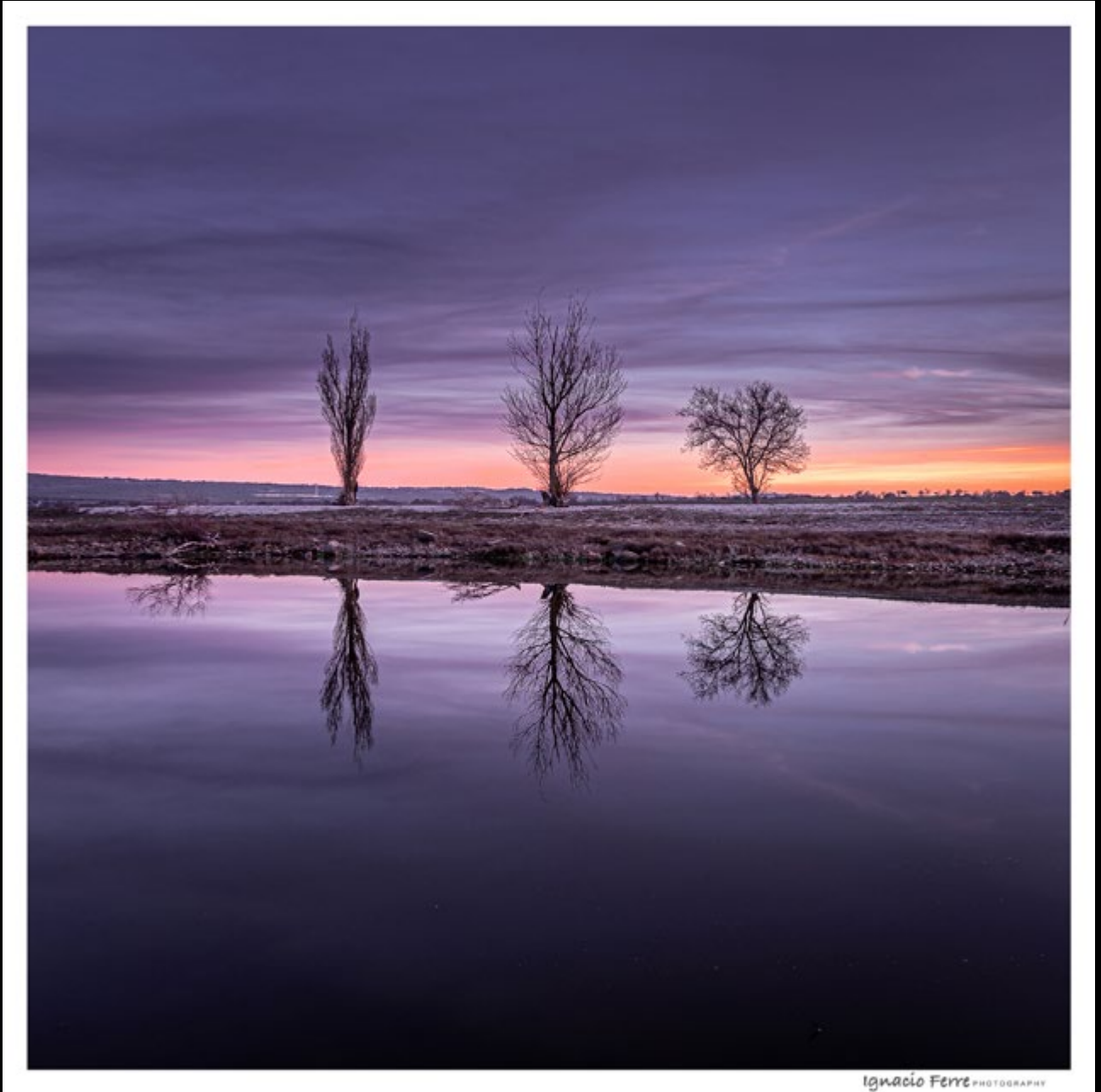
Winter trees (Ignacio Ferre)