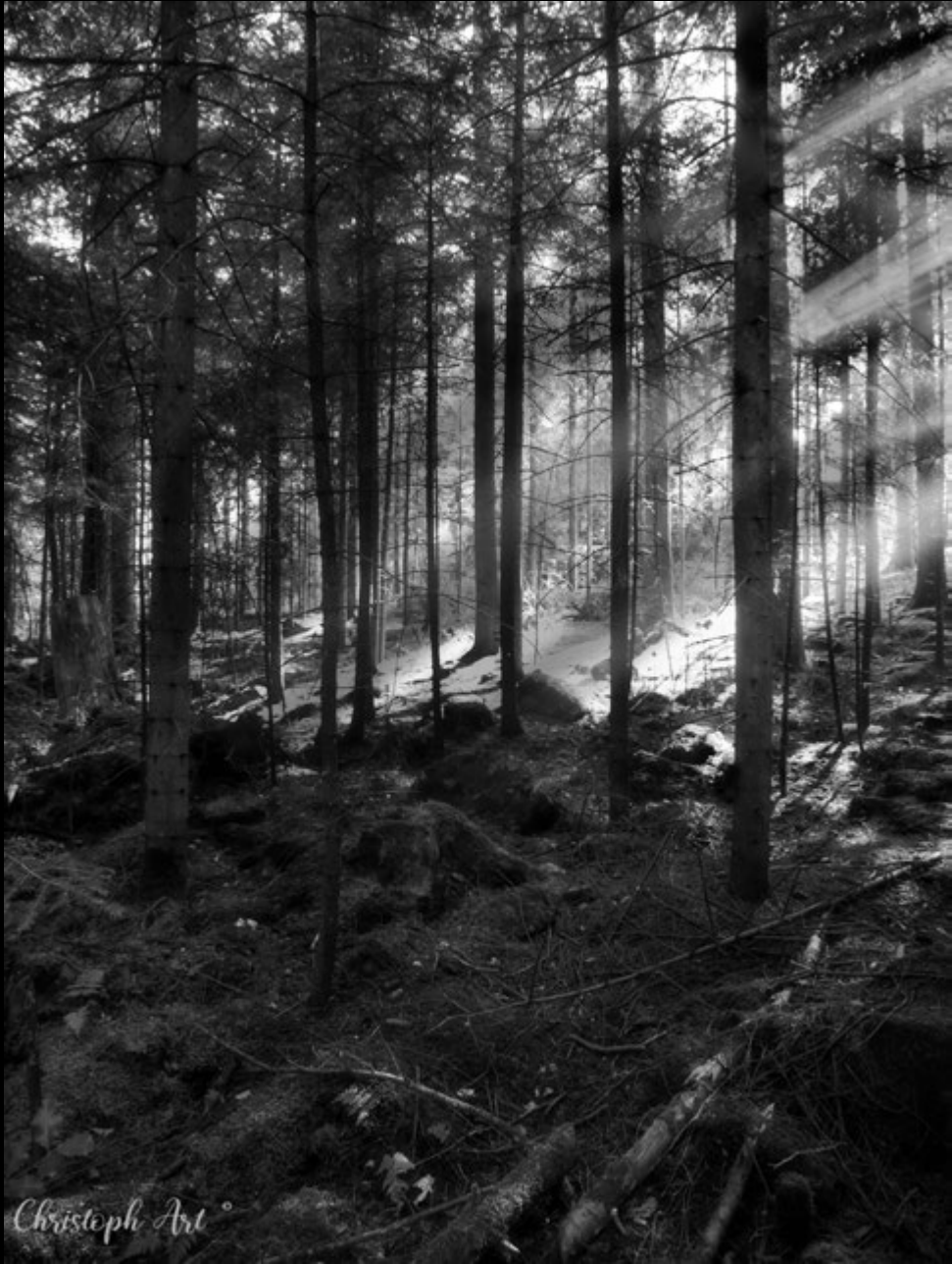
forest lights (waldampel)