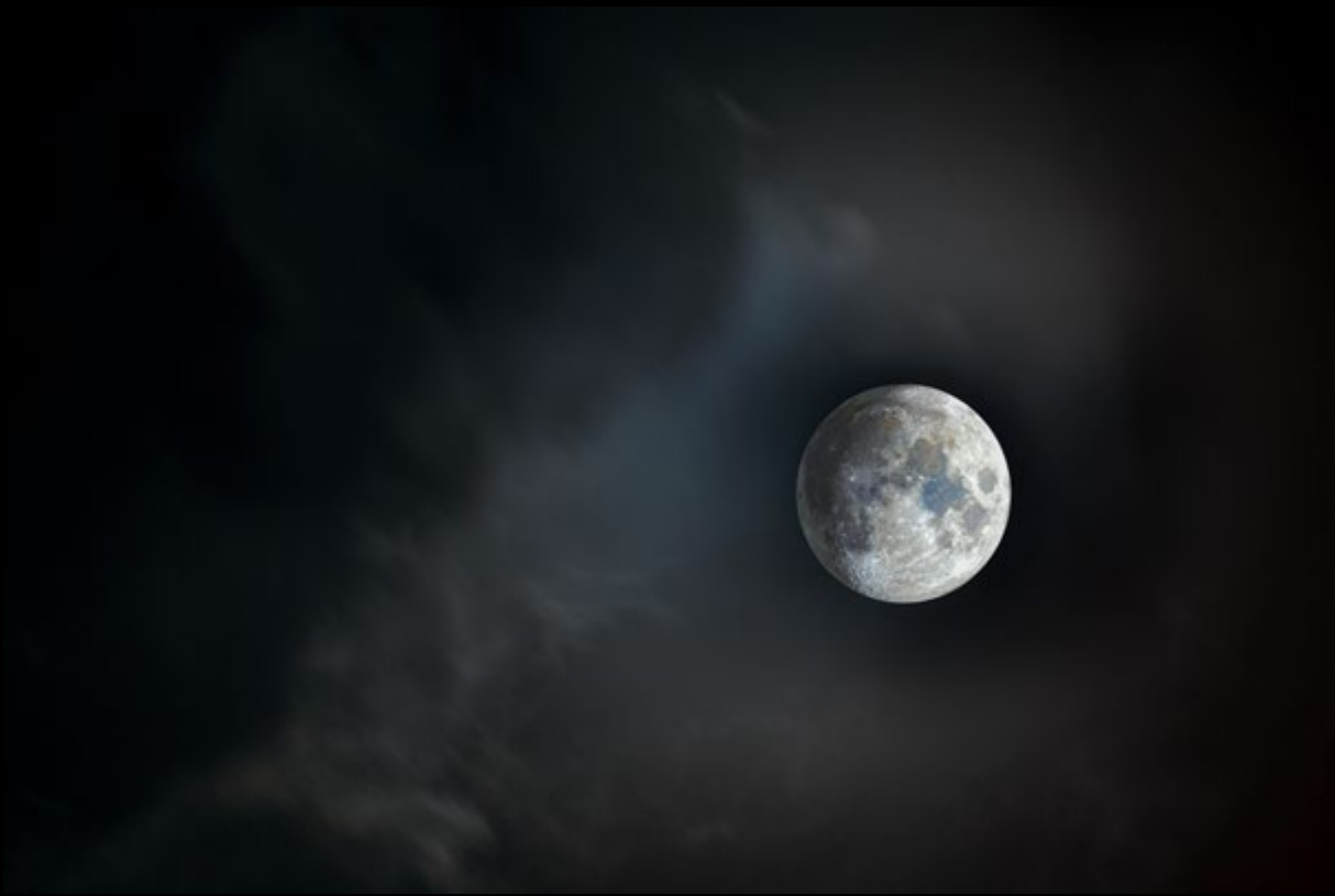
HDR Moon (Borja Rial Pereira)