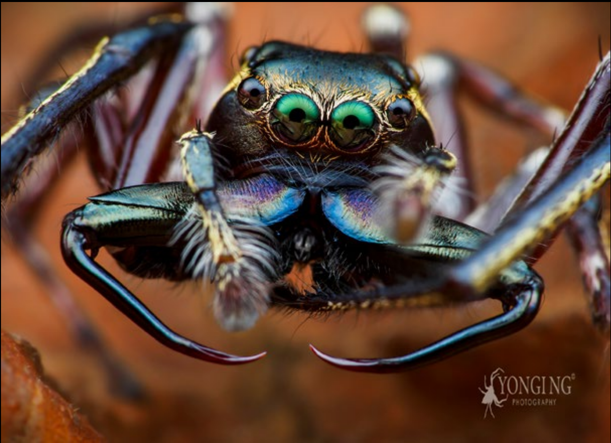
Male Pristobaeus sp. (Yongi Ng)