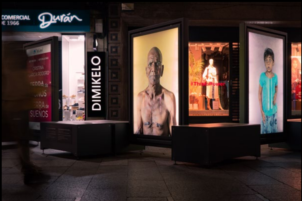
Arte na rúa (Charlón)

Grupo DNG Photo Magazine en Flickr: 6.601 miembros y 468.900 fotos subidas al mural.