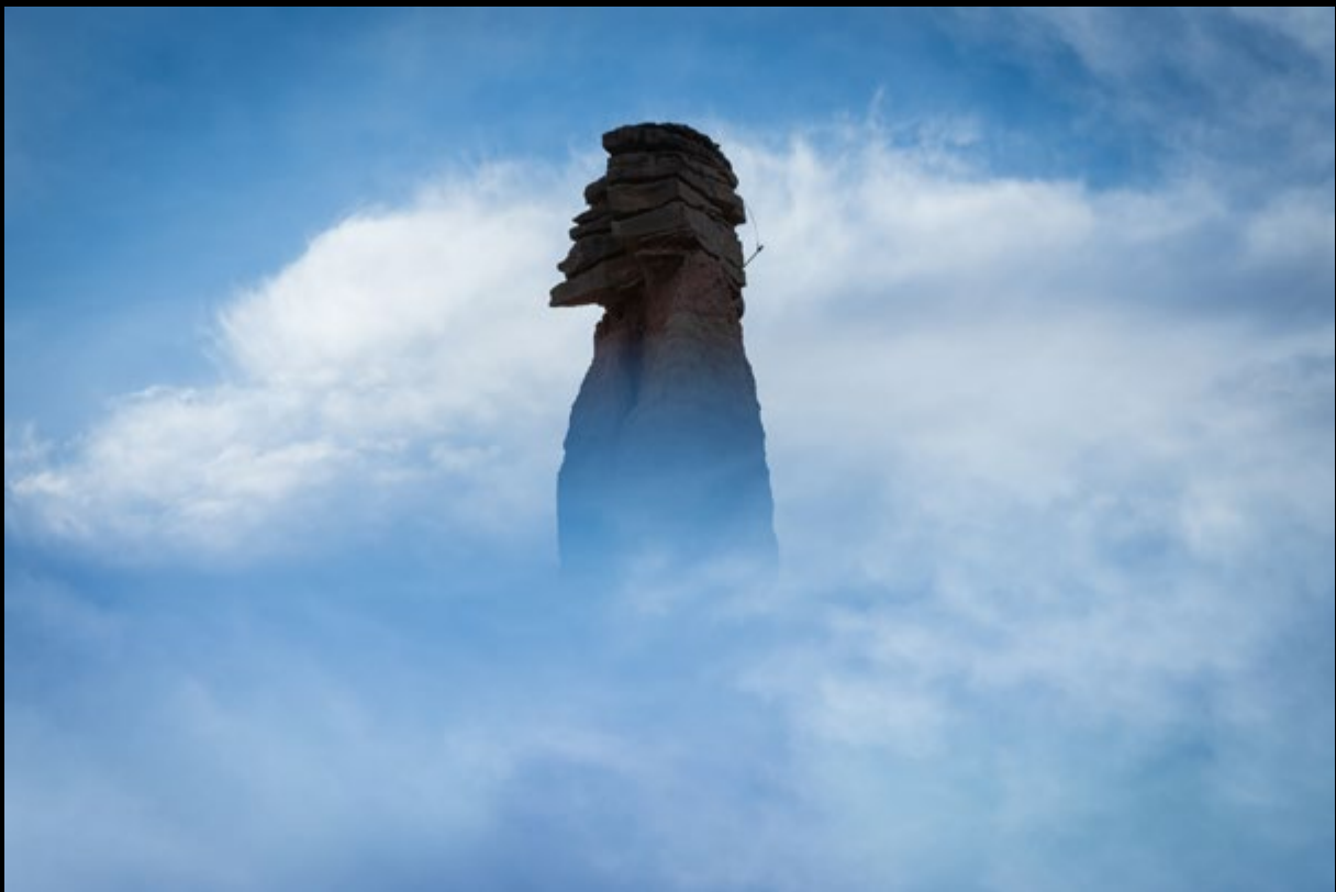
El espartano (Manuel Fdez)