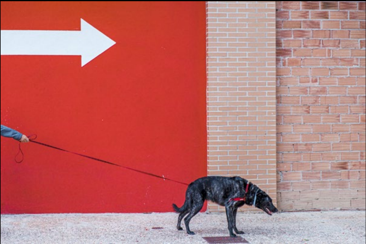
Siga la flecha (santizu108)