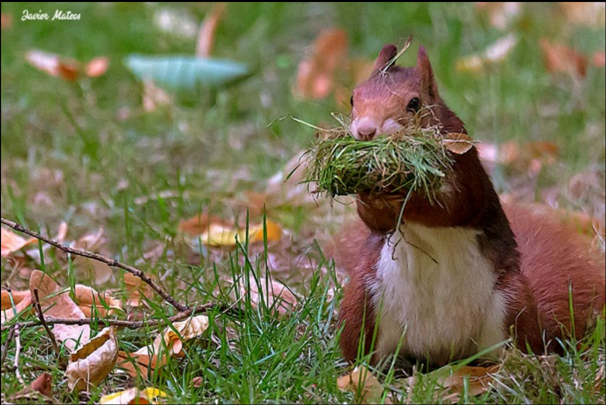
Ardillas en el Jardín del Príncipe de Aranjuez (frajamara)