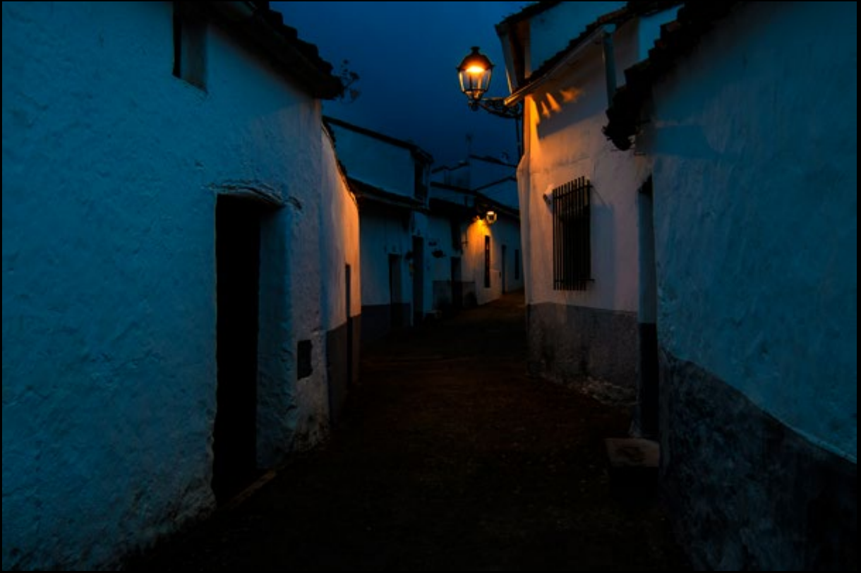
Cielo gris... (B.Rufo)